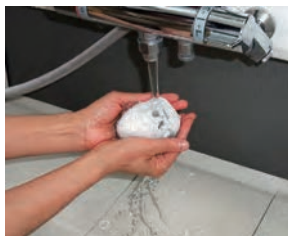
節約宣言SGRのろ過材

一般品に比べ極めて簡単です。吸い込み口のフィルターケースを取り外し、手のひらサイズのろ過材とスポンジをもみ洗いするだけです。しかも運転したままできるので楽々です。大容量フィルターやプレミアムは運転を停止して本体頭部の各ろ過材を定期的に洗浄します。一般品のように内部を開けての複雑な作業は不要で、簡単なお手入れで済みます。また他社品のように紫外線ランプなどの高額な消耗部品も必要ありません。ろ過フィルター自体に抗菌効果を持たせた画期的な技術により、ろ過フィルターの定期交換だけで制菌効果を維持できます。