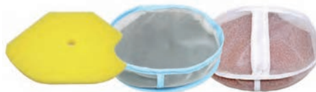
節約宣言プレミアムのろ過材