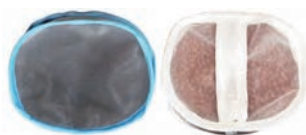
SGR大容量フィルターのろ過材